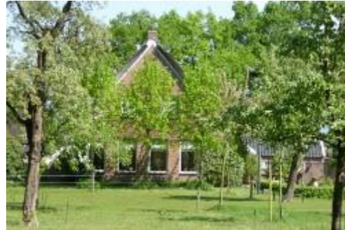
er is nog steeds een boomgaard

Als we om een paar appels vroegen was dat geen probleem. Maar het was spannender om de appels “stiekum” te plukken.