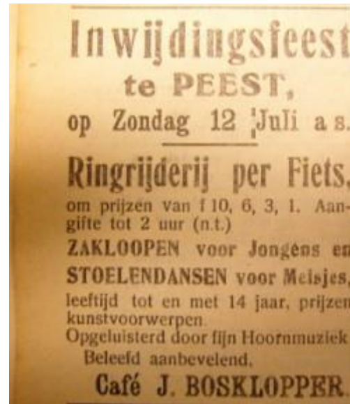
Advertentie Leekstercourant jaargang 1925

Jaap en Lien Spoelder vormden het café om tot een specialiteiten restaurant en noemden het ' De Jagershof '.