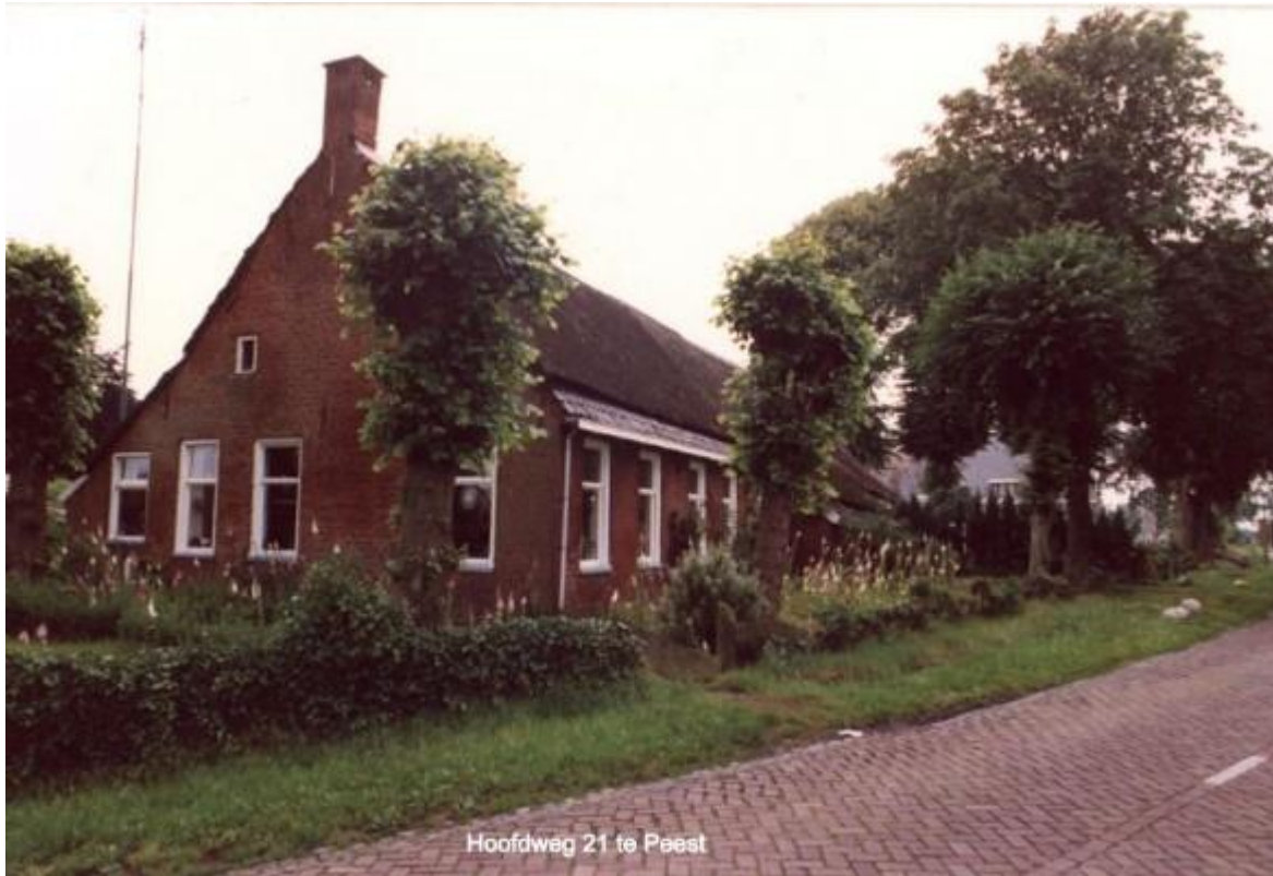
Het oudste bekende "Arendshuis"

Andere boerderijen en landerijen werden verpacht Hun bezittingen beperkten zich niet tot Peest en omstreken, van de Groninger klei ontvingen zij gelden uit "beklemming"