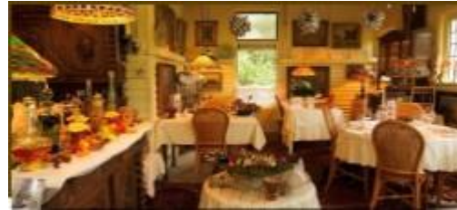
Nu met gedekte tafels bij Joop en Christel