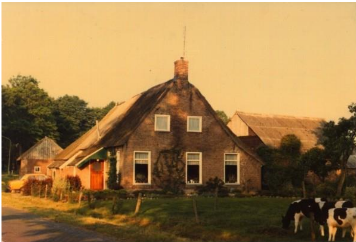
Hoofdweg 16 in de negentiger jaren, met een kalverkampje.

Een leuke bijvangst tijdens het onderzoek: Een aantekening uit het geboorte register.