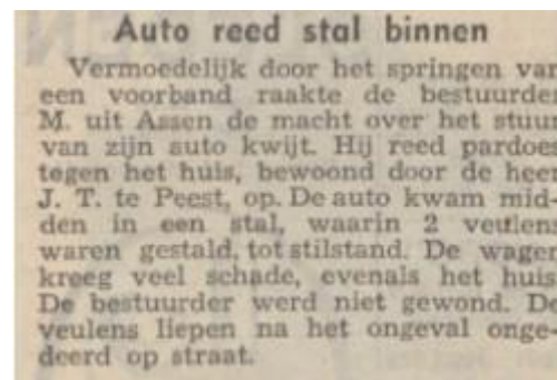
Nieuwsblad van het Noorden 29 januari 1954

Er waren vroeger nog al eens een automobilisten die vanuit Norg komende de bocht verkeerd inschatten en in het achterhuis schaadpijk 1 eindigden.