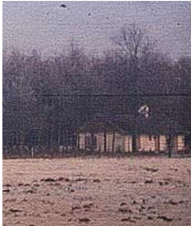
De afgebroken woning (ossenshuur) aan Het Westerveen