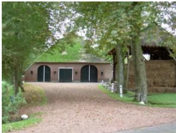
De achterzijde van Brinkweg 1

Erf 4a. (nieuwe wevershuis) Hoofdweg 13 bewonersgeschiedenis erf hoofdweg 13, Peest door: Wim Gelling en Riekus Hartlief