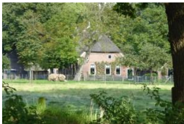
De voorzijde van Brinkweg 1