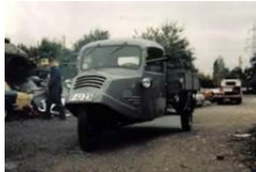
De driewieler voor hij rechttuit reed

Gelukkig viel de persoonlijke schade meestal wel mee.