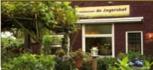
"De Jagershof" anno 2013

Tot 1900 beleefde Peest praktisch geen uitbreiding, de bebouwde kom eindigde aan de oost zijde waar hij nu ook eindigt. Boerderij hoofdweg 11 vormde toen het eind van de bebouwing aan de westzijde. Tussen 1900 en 1930 vond er een uitbreiding plaats met de boerderijen Hoofdweg 9 aan de noordzijde van de Hoofdweg en 8, 10, en een keuterboerderij annex kruidenier en café Hoofdweg 12 aan de zuidzijde van de weg.