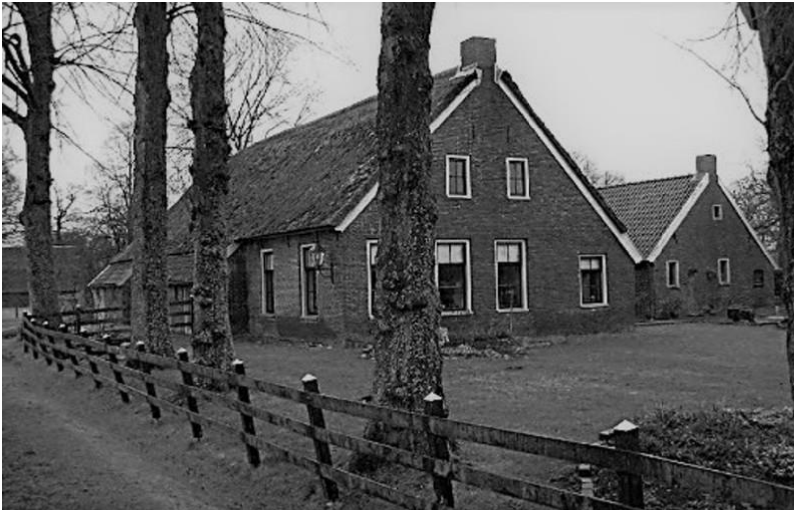
Gegevens historische vereniging Norch. (H.hartlief)

Dit huis is in 1843 gebouwd in opdracht van de markgenoten van Peest.